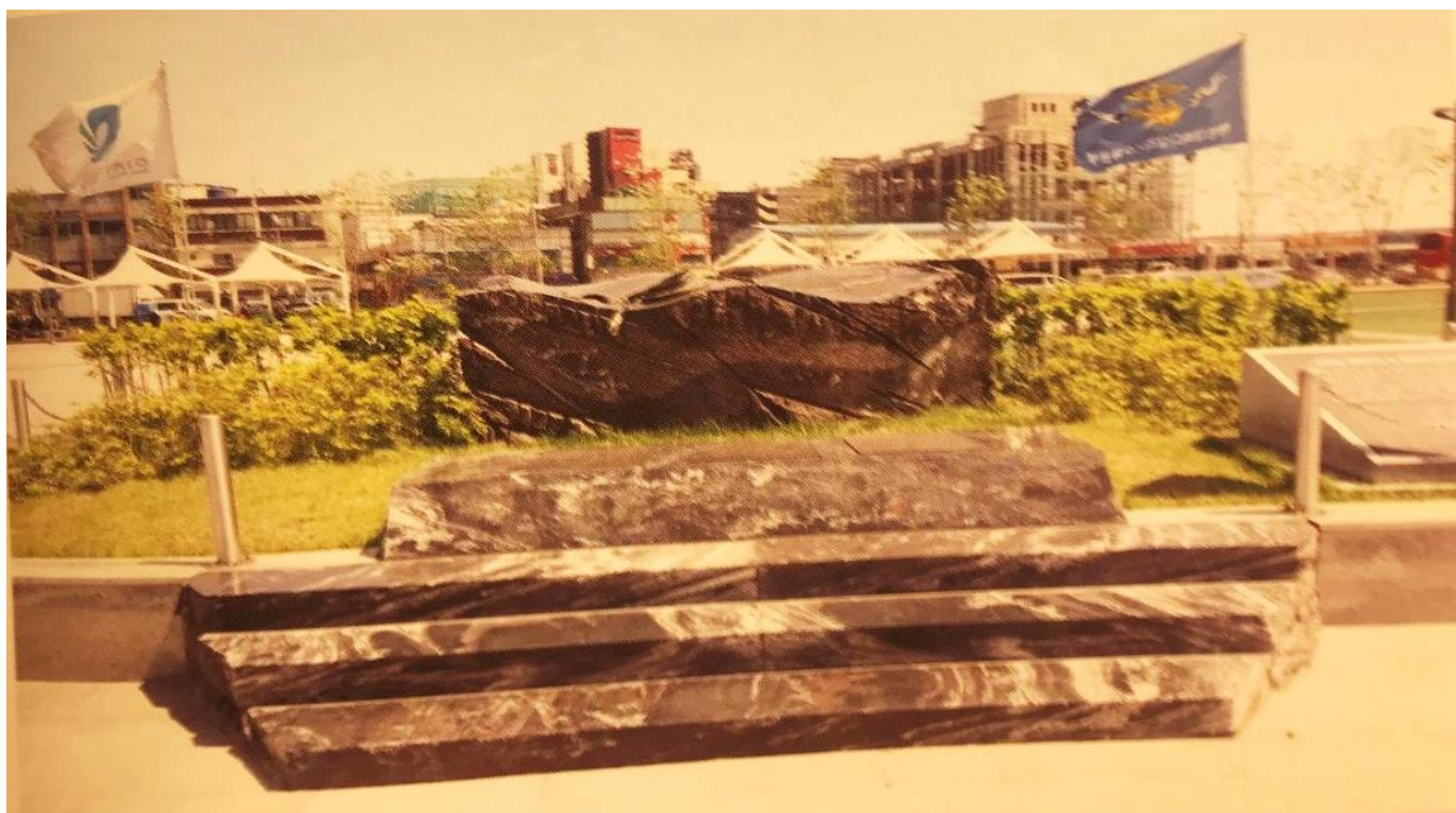
Рис. 6 и 7. 2005 г. Инчхон. Санкт-Петербургская площадь. Памятник погибшим морякам России