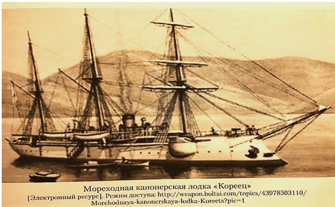
Рис. 5. Канонерская лодка «Кореец»