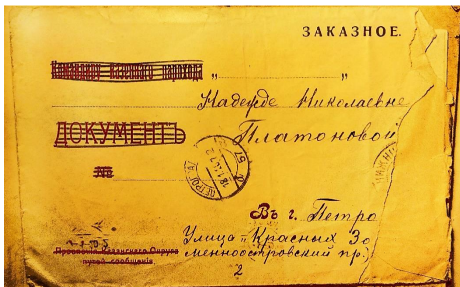
Образец конверта. ОР РНБ. Ф. 585. Оп.1. Ч.2. Д. 6125. Л.2