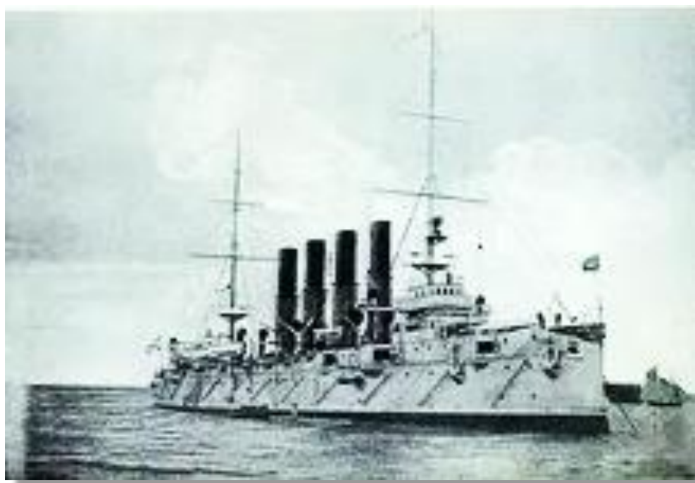
Рис. 4. Крейсер «Варяг»