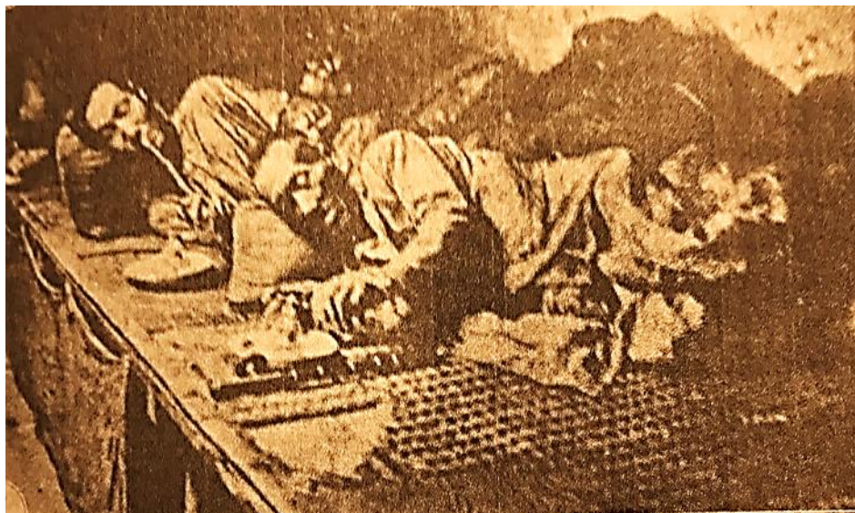
Рис. 2. Притон опиокурения

Вопрос об условиях расселения этнических меньшинств на Дальнем Востоке специально рассматривался в трудах Е.Н. Чернолуцкой, А.Т. Кузина и других авторов [16; 11].