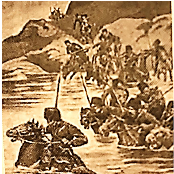
Рис. 1. Казачьи воинские соединения на Дальнем Востоке

Известно, по сведениям жандармско-полицейского надзора Маньчжурской армии, Отдельного корпуса штаб-офицера подполковника Шершова, что таких подозреваемых было 241 человек, в том числе 10 корейцев [ГАРФ. Ф.1182. Оп.1. Д.7. Л.1–6. Опубликовано]. Сведения о более 200 японских агентах из числа корейского населения, их действиях, в частности о наличии и выселении корейцев из приграничных районов, находят подтверждение в процессе исследования названной стороны вопроса в документах штаба [1].