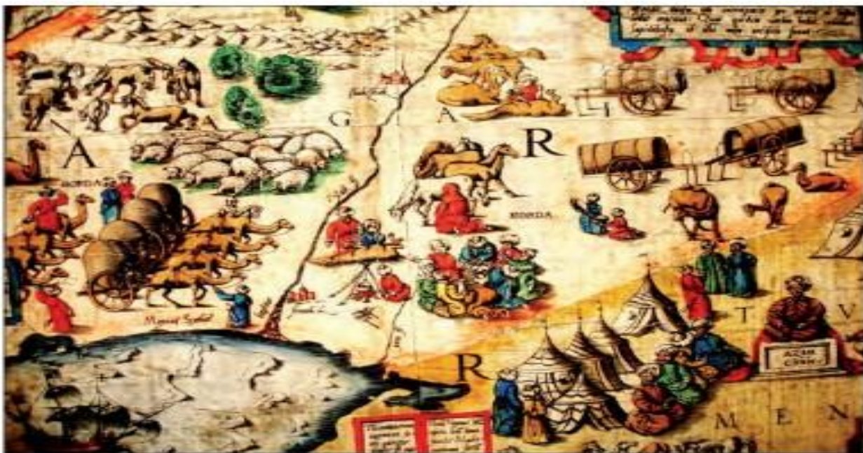
Рис. 1. Фрагмент карты Московии Энтони Дженкинсона с изображением р. Яик (Урал) и сцен из жизни кочевников Ногайской Орды

Возрастающая роль казахских ханств в политическом ландшафте, связывающем Крымское ханство, Ногайскую Орду и Русское государство, находит подтверждение в переписке Селим Гирея с московским князем. В частности, крымский хан подчеркивает значимость казахского правителя, называя его своим «братом». Этот фактор, наличие влиятельного соседа, предопределил первоочередность задач для Русского государства: вместо немедленной экспансии на новые территории, приоритетом стало укрепление и обустройство уже освоенных земель.