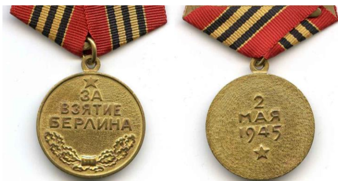
Медаль «За взятие Берлина» учреждена Указом Президиума ВС СССР от 9 июня 1945 года в честь взятия Берлина в ходе Великой Отечественной войны.