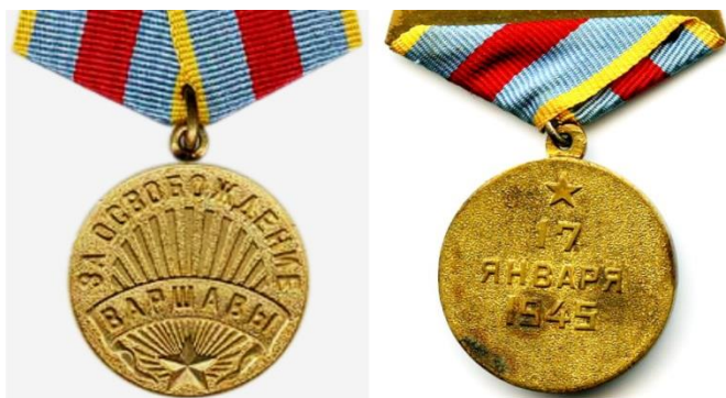
Медаль «За освобождение Варшавы» учреждена Указом Президиума ВС СССР от 9 июня 1945 года в честь освобождения Варшавы в ходе Великой Отечественной войны.