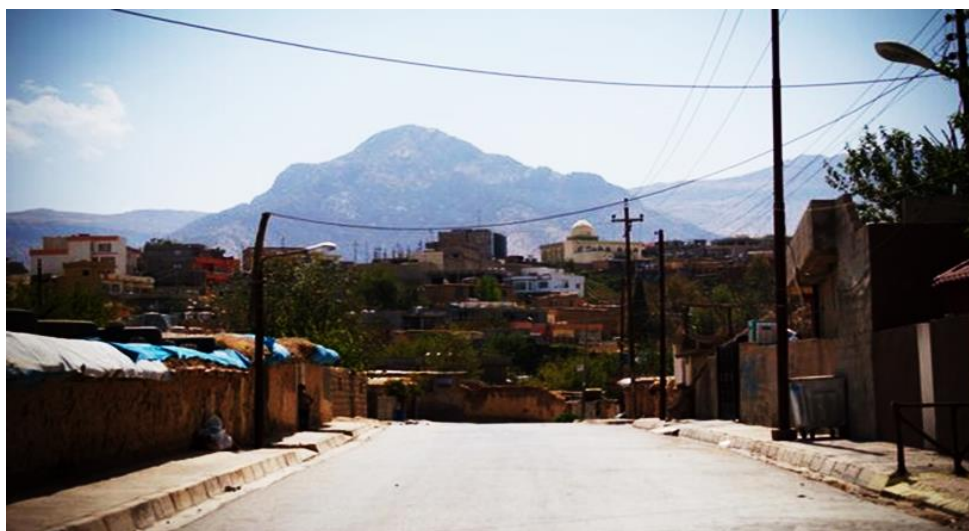
Г. Равандуз. Население – 124 989 человек (2012 г.)