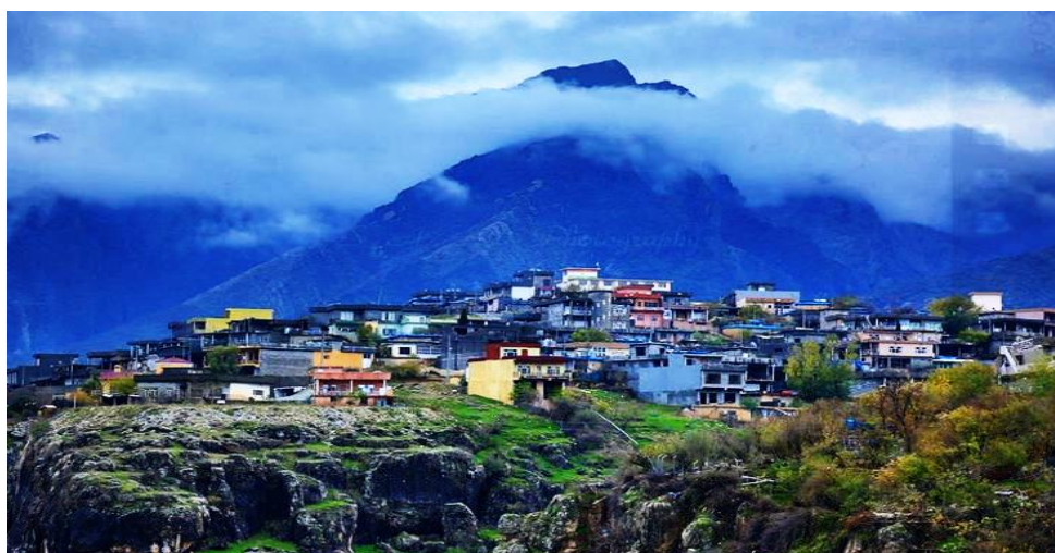
г. Равандуз, накрытый облаками. Регион Курдистан – Ирак.