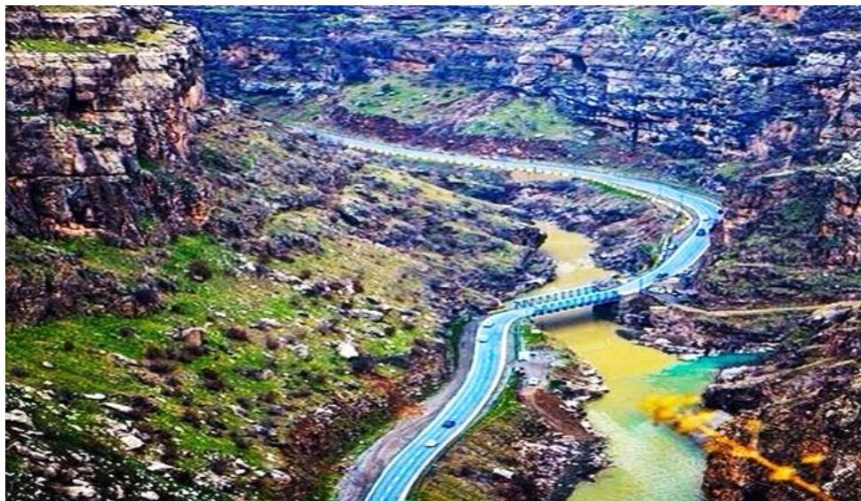
Дорога, соединяющая населенные пункты на северо-востоке Курдистана